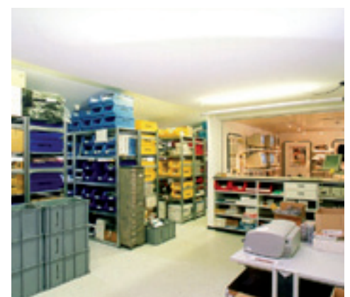
Über 5000 Artikel an Lager